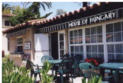
HOUSE OF HUNGARY NEWSLETTER – HÍRLAP August - September 2007