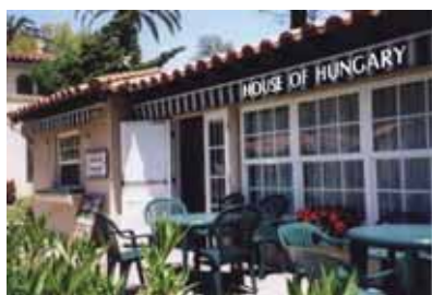
HOUSE OF HUNGARY NEWSLETTER – HÍRLAP June - July 2005