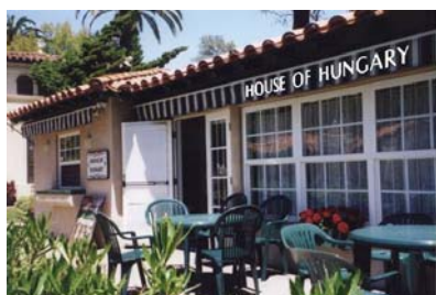
HOUSE OF HUNGARY NEWSLETTER – HÍRLAP June - July 2007